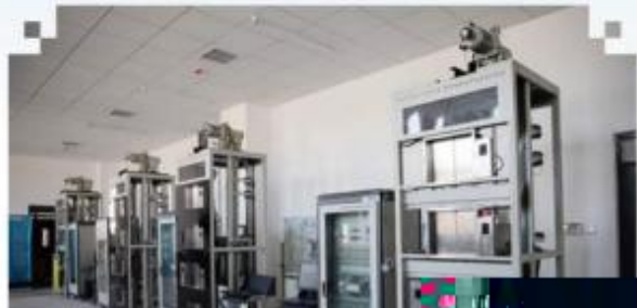
自动化生产线安装与 调试训练场所